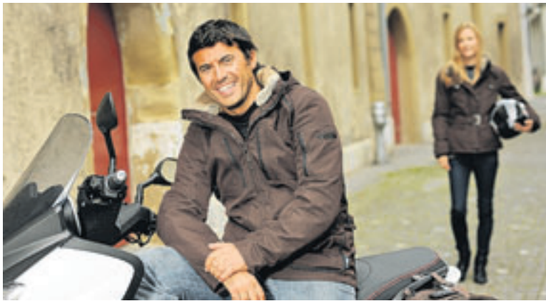
Moderne Rollerbekleidung ist kaum mehr von Freizeitmode zu unterscheiden.

auf einem schweren Motorrad gegen Verletzungen schützt. Auf dem Roller scheint diese Vernunft jedoch vielen Verkehrsteilnehmenden abhandzukommen. Nur so sind die vielen Rollerfahrer im T-Shirt und in kurzer Hose