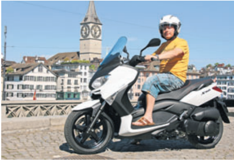
Luftig, bequem und ziemlich gefährlich: unangemessene Bekleidung auf dem Roller.

Eigentlich wäre es einfach: Nebst dem obligatorisch vorgeschriebenen Helm gehört zur angemessenen Bekleidung eine abriebfeste Jacke, eine Hose aus ähnlichem Material mit Protektoren an Knien und Seiten, mindestens knöchelhohes Schuhwerk sowie Handschuhe. Also Kleidung, mit der sich ein vernünftig denkender Mensch auch